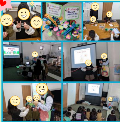
ヤクルト出前授業