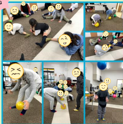
キッズトレーニング